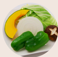
◀焼き野菜盛り合わせ 一人前 432円