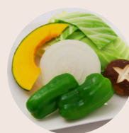
◀焼き野菜盛り合わせ 一人前 432円