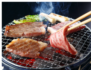
◦ 脂がうまい!和牛ロース