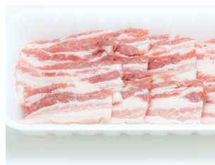
◦ 豚肉 ◦ 鶏肉