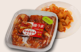
◀ダイコンキムチ 572円