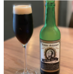
飲みやすくてコクのある 明治維新（黒）