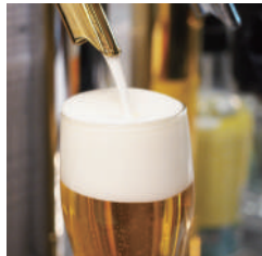
乾杯は生でいかがでしょう！