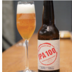
クラフトビール No.1 人気 IPA100